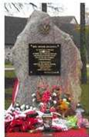
Pomnik upamiętniający 90 rocznicę odzyskania przez Polskę Niepodległości