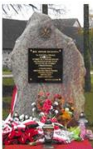
Pomnik upamiętniający 90 rocznicę odzyskania przez Polskę Niepodległości