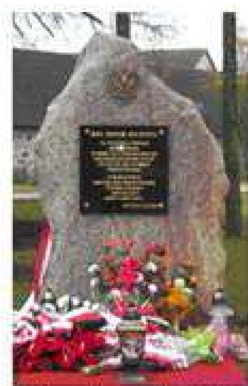
Pomnik upamiętniający 90 rocznicę odzyskania przez Polskę Niepodległości